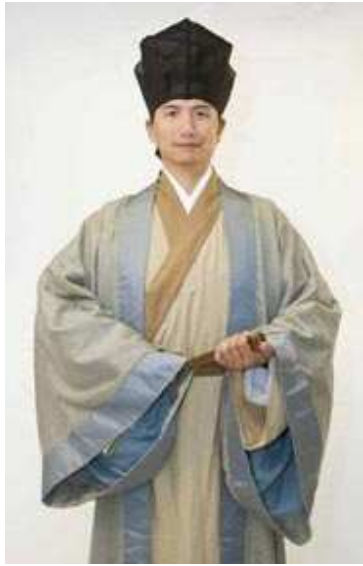
正面（10 cm×15 cm）